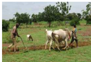
Bœufs pour le compost et labour rapide pour réussir les semis