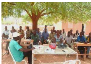
Formation à l'agroécologie et agroforesterie