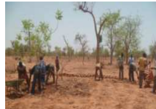
Cordons pierreux pour retenir l'eau et la terre