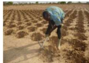
Zai amélioré : possibilité de mécaniser la technique avec les bœufs

Rendements x 3 ou 4 sans irrigation sans intrants (1)