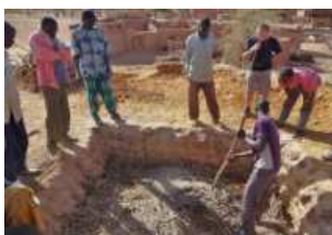
Fosses de compostage