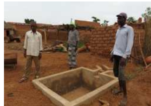
Biodigesteur (en construction) produit du gaz pour cuisiner, s'éclairer et de l'engrais

(1) Semences achetées, engrais, traitement